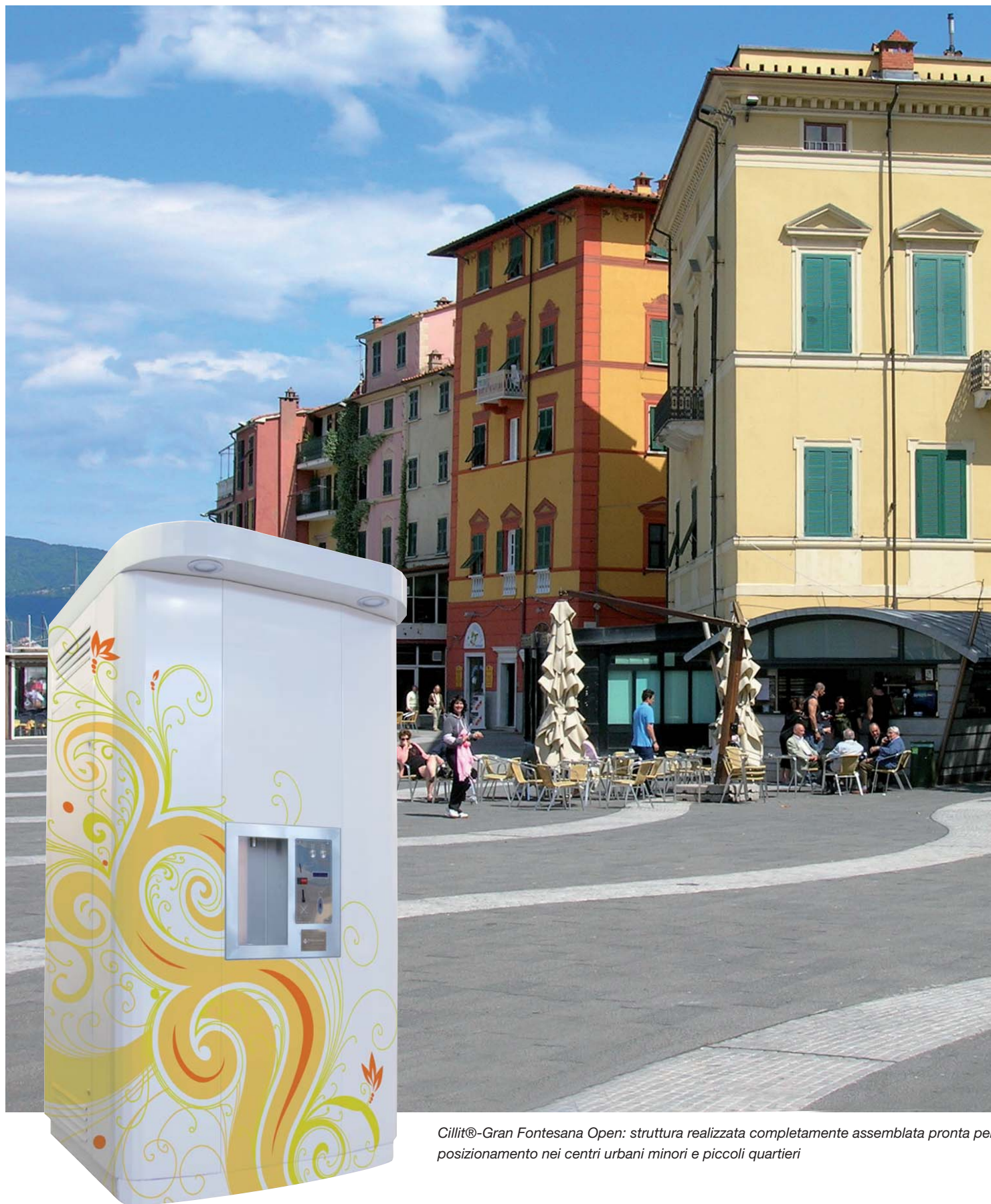
Cillit®-Gran Fontesana Open: struttura realizzata completamente assemblata pronta per il posizionamento nei centri urbani minori e piccoli quartieri

Il Cillit® Gran Fontesana Open è una fonte inesauribile di acqua affinata refrigerata e refrigerata gassata