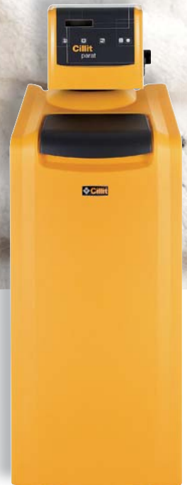
Parat Data Cyber 78