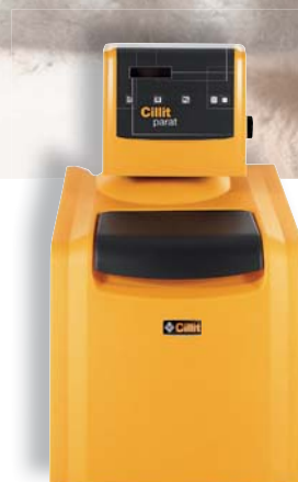
Parat Data Cyber 32

Inoltre è ideale per l'igiene personale e per sentirsi in forma.