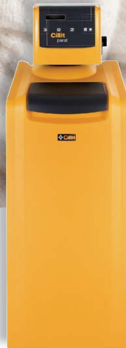
Parat Data Cyber 58